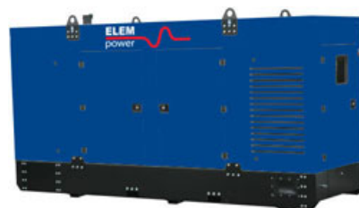
fotografia poglądowa agregatu wyciszonego